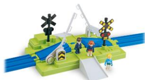
J-27 プラキッズふみきりセット