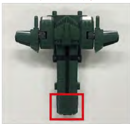
ドローンユニット